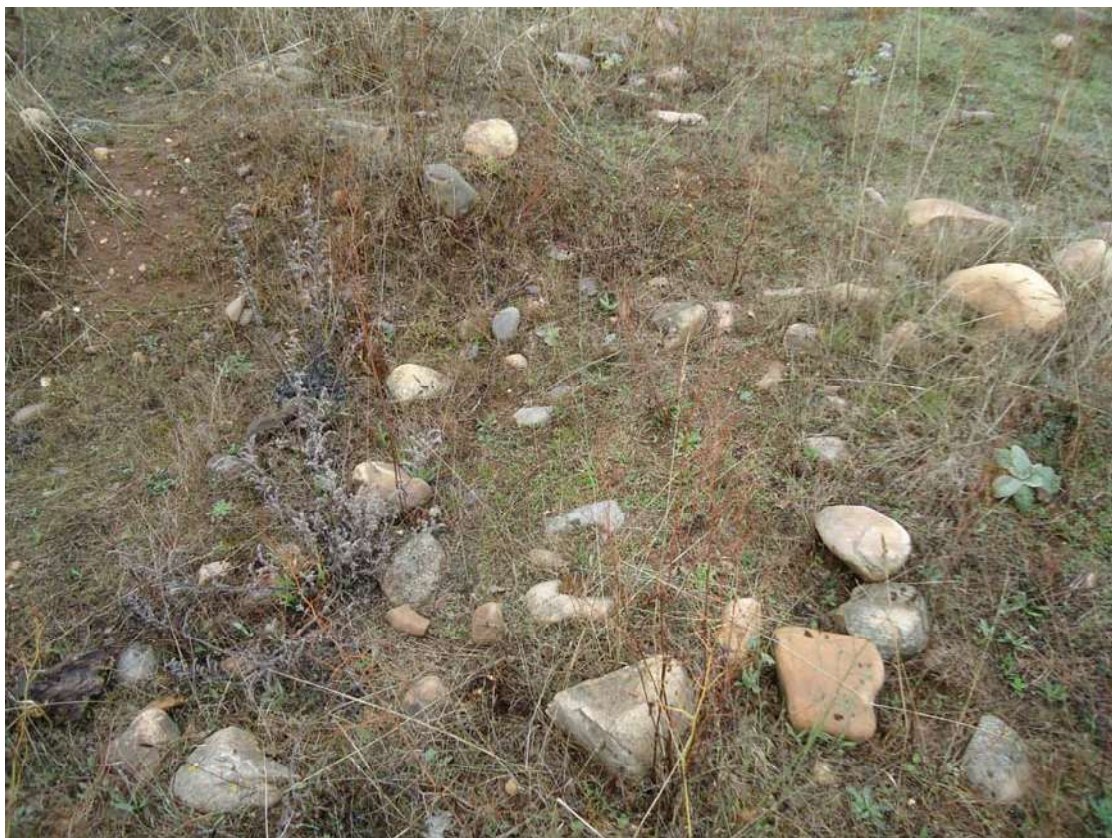
Foto 5. Terrazas del Bernesga. El Crispin, La Robla.