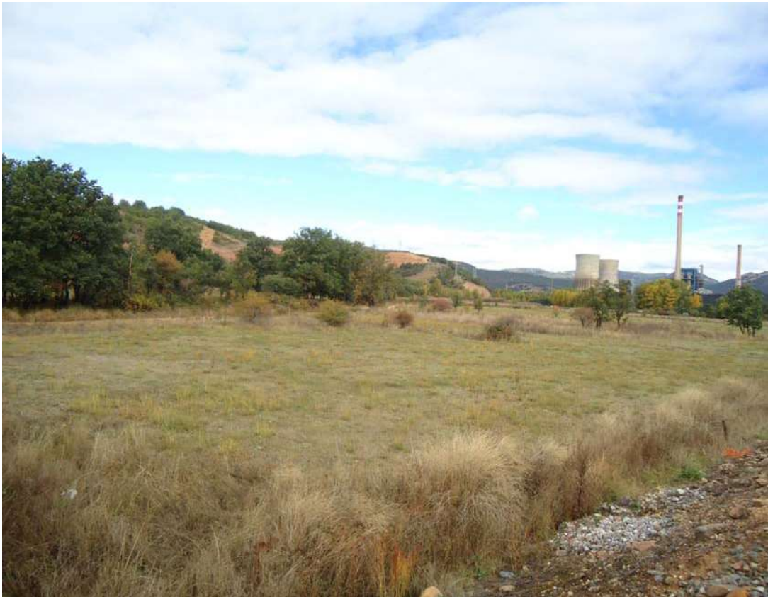
Foto 1. Vega El Crispin, La Robla. Vista general hacia el norte.