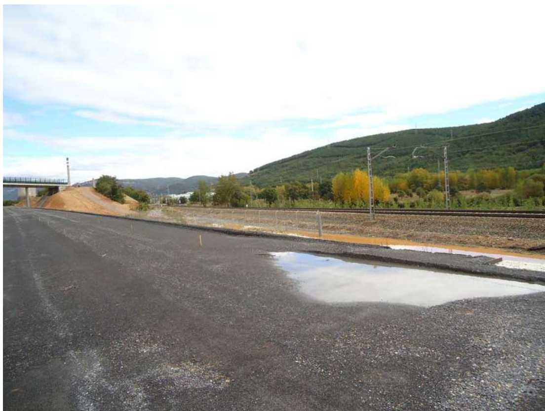
Foto 6. Trazado del AVE y de la RENFE. El Crispin, La Robla.