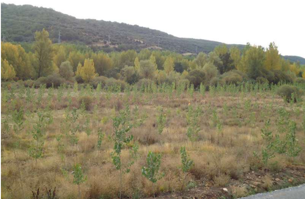
Foto 4. Extremo sureste El Crispin, La Robla. Choperas.