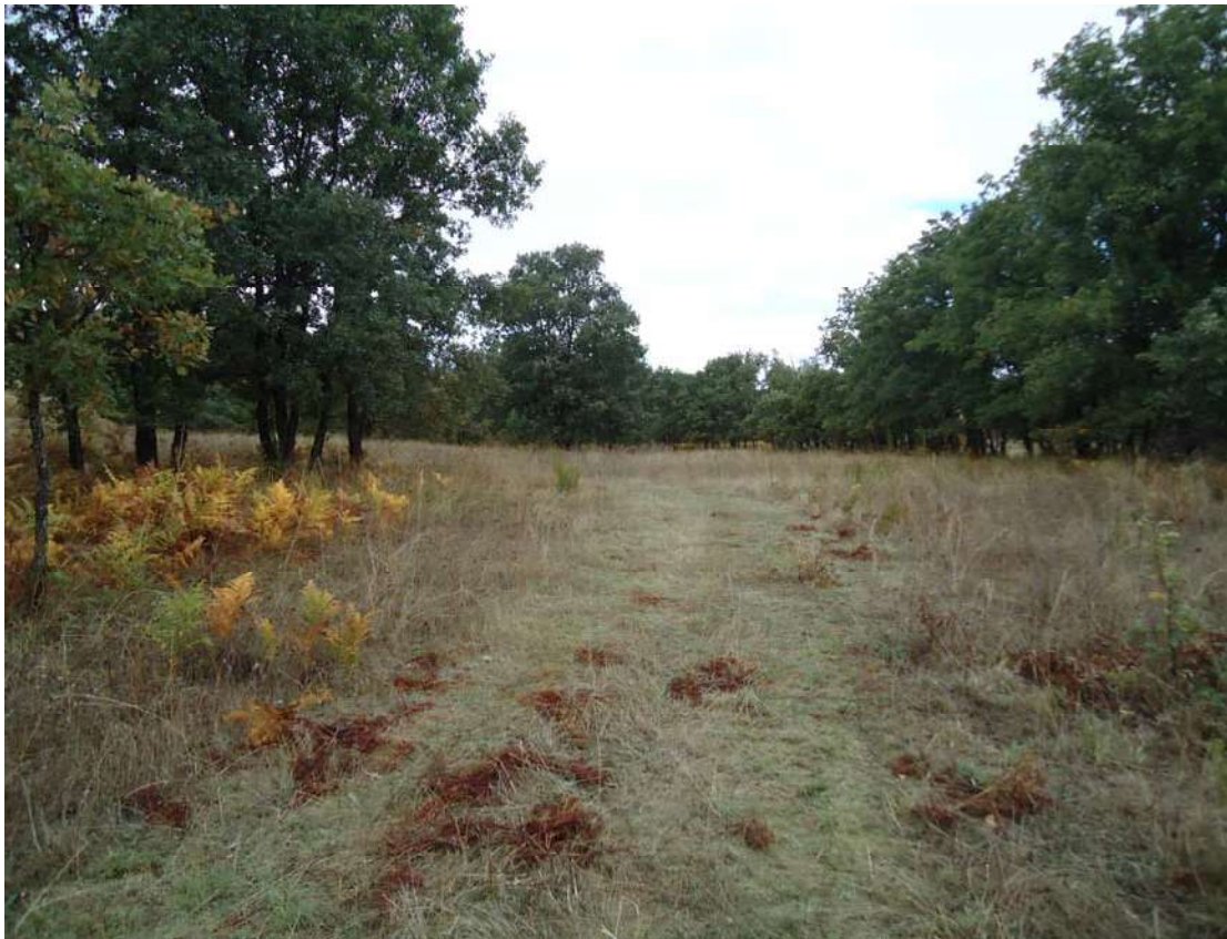
Foto 2. Parcela situada en el lado W. El Crispin. La Robla.