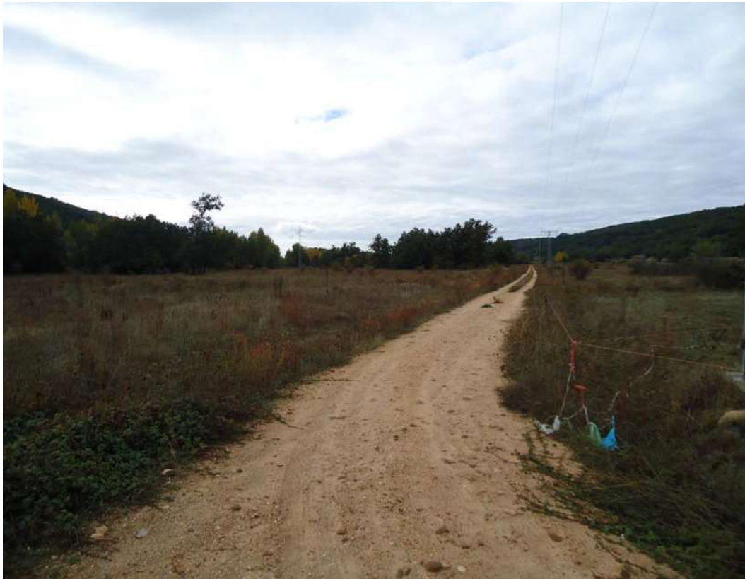
Foto 3. Parcelas afectadas por caminos de concentracion parcelaria. Zona central.